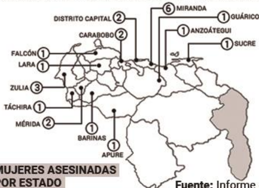
MUJERES ASESINADAS POR ESTADO

Del total de 23 casos, en 5 de ellos abandonaron el cuerpo de la víctima en la vía pública; en 5 casos hubo signos de tortura; y en 2 casos, intentaron simular suicidios.