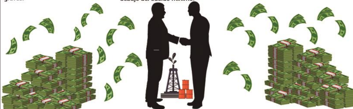
Fuente: Resúmenes de investigaciones de Armando.Info que puede leer completas en Armando.Info.

Pero el Ministro trinitario, Keith Rowley, ha dicho que "no podemos ni permitiremos que los voceros de la ONU nos conviertan en un campo de refugiados".